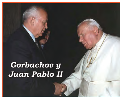
Gorbachov y Juan Pablo II

Detengámonos en estas dos expresiones: «Cierta espíritu de rebeldía contra la Iglesia actual» y «Su inserción en la realidad eclesial de la actualidad». Pues bien. Los seminaristas de la Fraternidad Sacerdotal son católicos por haber recibido el Bautismo; nacieron y crecieron dentro de la corriente predominante de la Iglesia Católica; no formaban parte de la supuestamente “cismática” Sociedad de San Pío X, fundada por el Arzobispo Marcel Lefebvre, famoso por su oposición a los cambios posconciliares. No. Eran jóvenes procedentes de la corriente predominante de la Iglesia e ingresaron en los Seminarios de la Fraternidad Sacerdotal de San Pedro para obtener una formación tradicionalista y para celebrar la tradicional Misa en latín.