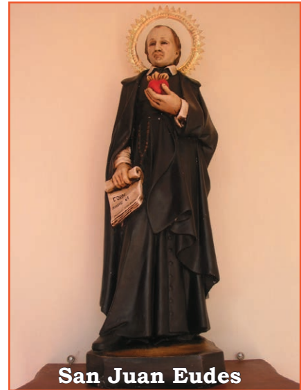
San Juan Eudes

Os ruego que penséis que Jesucristo, Nuestro Señor, es vuestra verdadera Cabeza, y que vosotros sois uno de sus miembros. El es con relación a vosotros lo que la cabeza es con relación a sus miembros; todo lo que es suyo es vuestro, su espíritu, su Corazón, su cuerpo, su alma y todas sus facultades, y debéis usar de ellos como de cosas que son vuestras, para servir, alabar, amar y glorificar a Dios. Vosotros y él sois como los miembros y su cabeza. Así desea él ardientemente usar de todo lo que hay en vosotros, para el servicio y la gloria de su Padre, como de cosas que son de él (San Juan Eudes).