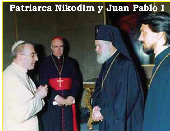
Patriarca Nikodim y Juan Pablo I