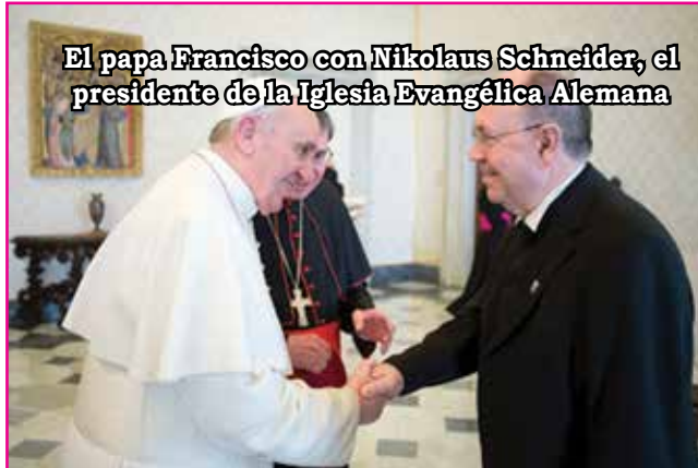
El papa Francisco con Nikolaus Schneider, el presidente de la Iglesia Evangélica Alemana

Católica, así como en otras iglesias, forma parte de la “línea general” [o sea, del programa inmutable] del Partido en su lucha antirreligiosa. » En efecto, centenares de documentos pasados al Occidente por el antiguo archivero de la KGB, Vassili Mitrokhin, y publicados en 1999, relatan igualmente que la KGB cultivaba las más estrechas relaciones con los católicos “progre-