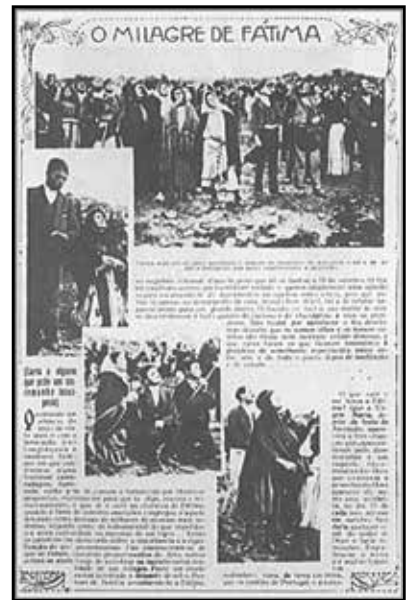
Diarios de la época registran la veracidad del Milagro del Sol

Recordando el texto del Secreto, de que hemos tratado en el capítulo 1, es obvio que lo que allí propone el Cielo sería un anatema para el régimen masónico en Portugal, como lo sería también para todas las fuerzas organizadas contra la Iglesia, las cuales, al comienzo del siglo pasado, estaban tramando un ataque decisivo a la ciudadela católica: como veremos, esas mismas fuerzas así lo admitieron. Los elementos básicos del Mensaje constituyen una auténtica “carta estratégica” de oposición a esas fuerzas: librar las almas del Infierno; establecer por todo el mundo una devoción católica al Corazón Inmaculado de María; consagrar Rusia a ese Corazón Inmaculado, con la subsecuente conversión de ese país al Catolicismo; alcanzar la paz para el mundo, como corolario del triunfo del Corazón Inmaculado de María.