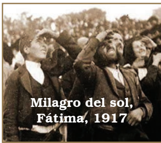
Milagro del sol, Fátima, 1917

Se podrían multiplicar interminablemente los testimonios sobre el fenómeno solar que ocurrió enseguida, atestiguado incluso por el laico editor-jefe de un periódico anticlerical. Veamos algunos otros: