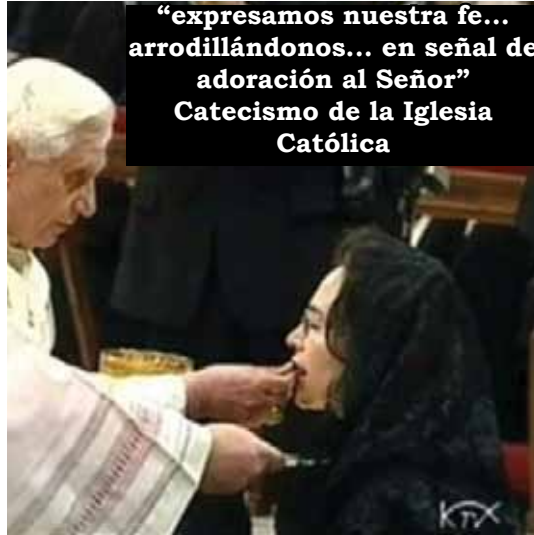
“expresamos nuestra fe... arrodillándonos... en señal de adoración al Señor” Catecismo de la Iglesia Católica

En la liturgia de la misa expresamos nuestra fe en la presencia real de Cristo bajo las especies de pan y de vino, entre otras maneras, arrodillándonos o inclinándonos profundamente en señal de adoración al Señor. “La Iglesia católica ha dado y continúa dando este culto de adoración que se debe al sacramento de la Eucaristía no solamente durante la misa, sino también fuera de su celebración: conservando con el mayor cuidado las hostias consagradas, presentándolas a los fieles para que las veneren con solemnidad, llevándolas en procesión”. El Sagrario (tabernáculo) estaba primeramente destinado a guardar dignamente la Eucaristía para que pudiera ser llevada a los enfermos y ausentes fuera de la misa. Por la profundización de la fe en la presencia real de Cristo en su Eucaristía, la Iglesia tomó conciencia del sentido de la adoración silenciosa del Señor presente bajo las especies eucarísticas. Por eso, el sagrario debe estar colocado en un lugar particularmente digno de la iglesia; debe estar construido de tal forma que subraye y manifieste la verdad de la presencia real de Cristo en el santo sacramento.