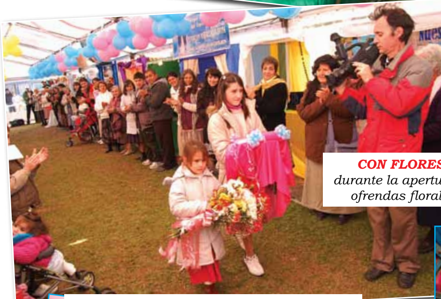
CON FLORES A MARÍA... durante la apertura se entregaron ofrendas florales a la Virgen