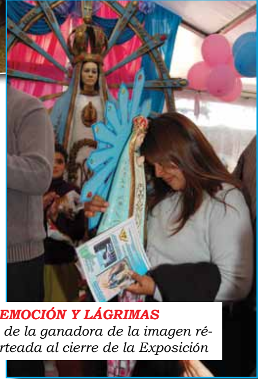
EMOCIÓN Y LÁGRIMAS de parte de la ganadora de la imagen réplica sorteada al cierre de la Exposición