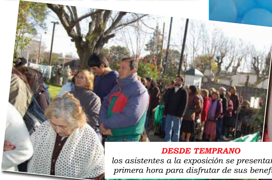
DESDE TEMPRANO los asistentes a la exposición se presentaron a primera hora para disfrutar de sus beneficios