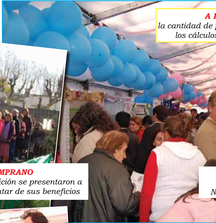
A la cantidad de p los cálculos