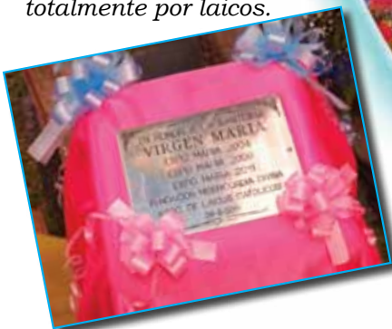
IMAGEN PEREGRINA cedida por la Municipalidad de Berazategui para el evento.

realizadas hasta la fecha, organizadas y costeadas totalmente por laicos.