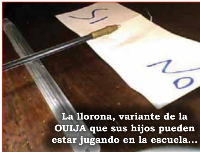
La llorona, variante de la OUIJA que sus hijos pueden estar jugando en la escuela...

Quería relatarle la historia de mi hermano, que a la edad de 14 o 15 años comenzó a jugar con un compañero de colegio. El espíritu que les hablaba les relató cosas como la guerra de Malvinas, (que posteriormente sucedió), les dio poder para adivinar algunas y determinadas cosas. Ellos le pidieron una vez a este espíritu que les dijera un número de la lotería para ganar mucho dinero, pero el espíritu les dijo