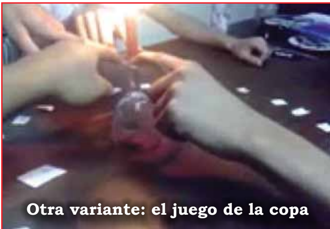
Otra variante: el juego de la copa