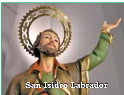
San Isidro Labrador