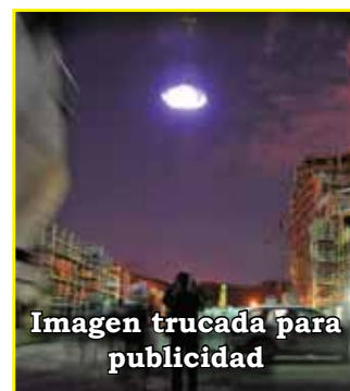
Imagen trucada para publicidad

“Están llevando a cabo prodigios y maravillas para confundir y enredar a la humanidad. Vosotros les lla-