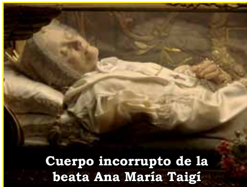
Cuerpo incorrupto de la beata Ana María Taigí