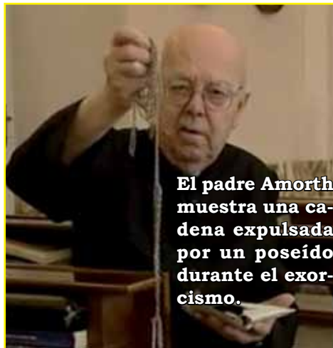
El padre Amorth muestra una cadena expulsada por un poseído durante el exorcismo.

El agua bendita es muy utilizada en todos los ritos litúrgicos. Su importancia está inmediatamente relacionada con la bendición bautismal. En la plegaria de bendición se pide al Señor que la aspersión con el agua nos dé estos 3 beneficios: el perdón de nuestros pecados, la defensa contra las insidias del maligno y el don de la protección divina. La plegaria del exorcismo sobre el agua añade muchos otros efectos: ahuyenta todos los poderes del demonio con objeto de extirparlo y expulsarlo. Incluso en el habla popular, cuando se quiere indicar dos cosas que no están en absoluto de acuerdo entre sí, se dice que son como el diablo y el agua bendita. Luego la plegaria continúa subrayando otros efectos, además de expulsar a los demonios: curar las enfermedades, aumentar la gracia divina, proteger las casas y todos los lugares donde moran los fieles contra toda influencia inmundada causada por el pestilente Satanás. Y añade: que las insidias del enemigo infernal sean vencidas y queden protegidos de cualquier presencia nociva