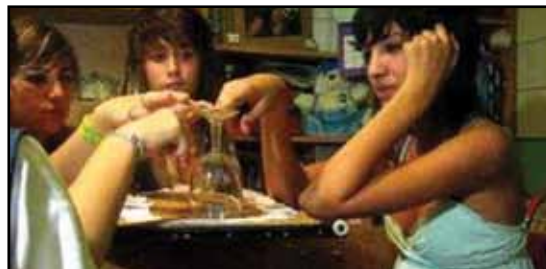
EL SATÁNICO JUEGO de la copa, puede terminar en posesión diabólica

«Los muchachos se inician, a veces muy jóvenes, picados por el morbo y la curiosidad. En ocasiones, comienzan con el espiritismo. Más adelante, pasan al ocultismo o al esoterismo y, por último, llegan al satanismo».