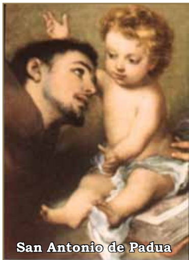
San Antonio de Padua

La multitud era impresionante, así como el silencio que había en el templo, esperando oír la voz del santo que había conmovido con sus palabras hasta a los peces del mar, en un increíble milagro.