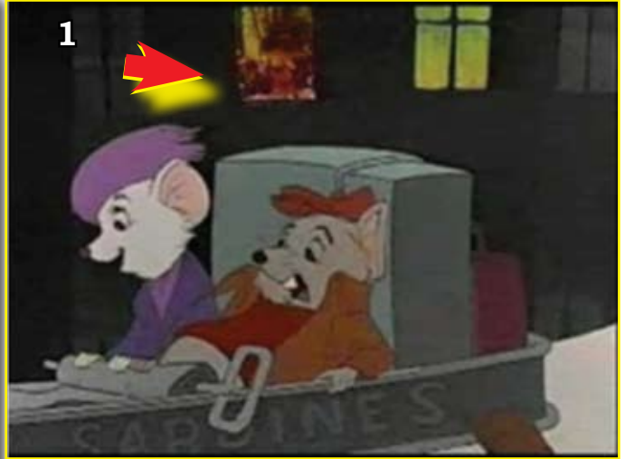
Mientras los ratoncitos caen, angustiados, en el fondo aparece una mujer totalmente desnuda. ¿Qué clase de mente perversa programó esta secuencia?

SANTUARIO DE JESÚS MISERICORDIOSO 153 ENTRE 27 Y 28 BERAZATEGUI