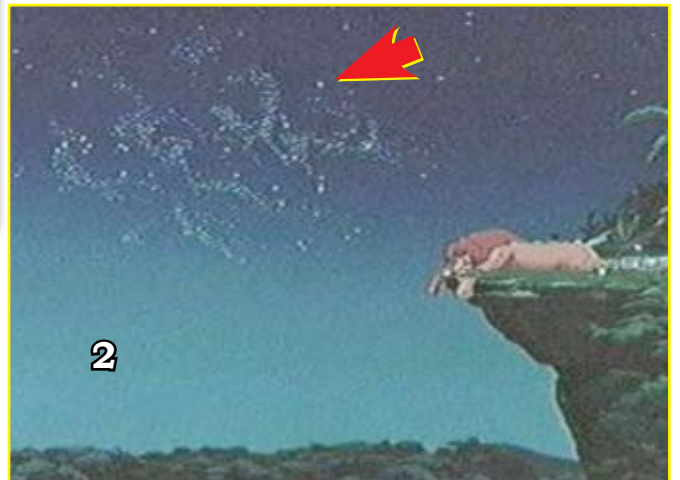
El joven Rey León duerme y sueña con algo “especial”, que no es exactamente una cosa apta para las mentes infantiles, y mucho menos si se oculta detrás de las formas de una inocente nube para colarse en sus mentes sin permiso...