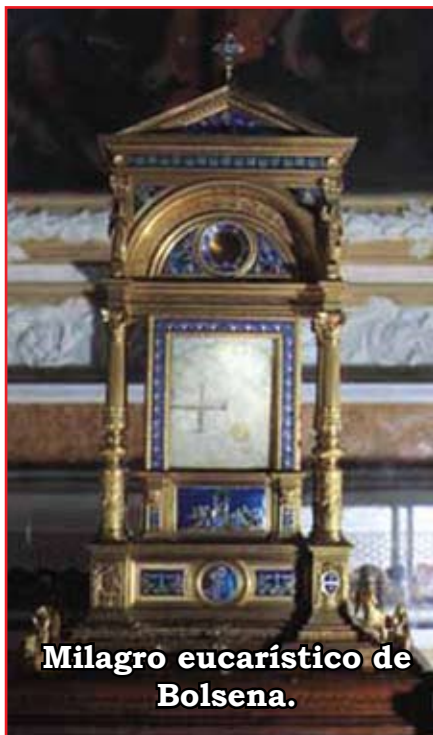
Milagro eucarístico de Bolsena.

Durante el año siguiente el Papa Urbano IV se ocupó casi exclusivamente en la labor de escribir la Bula Papal, Transiturus , la cual fue publicada el 11 de Agosto de 1264. Con esa Bula Papal instituyó la Fiesta de Corpus Christi en honor del Santísimo Sacramento, la Eucaristía, en la que se encuentran el cuerpo y la Sangre del Señor.