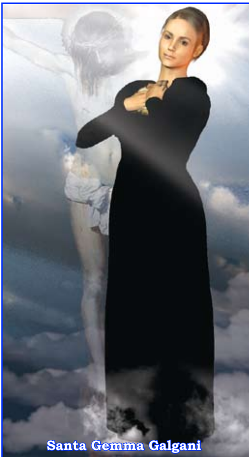
Santa Gemma Galgani

rá la piedra preciosa de nuestro Pontificado". Los grandes amores de Santa Gemma, durante toda su vida, fueron Jesús Crucificado, la Santísima Virgen María, la Eucaristía y la sed de conversión de las almas. Para ellos vivió toda su vida y por ellos murió como víctima de amor. ¡Santa Gemma Galgani, ruega por nosotros!