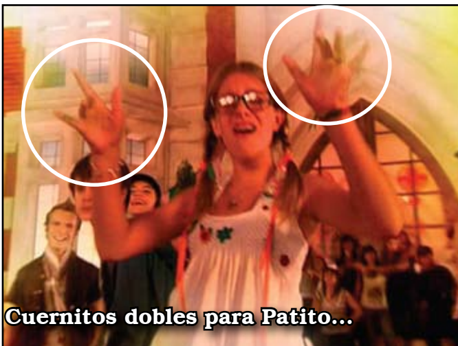
Cuernitos dobles para Patito...

Viendo el video que aparece dentro del contenido del CD, encontramos más "perlititas" que nos dan la razón para el título de esta investigación. Nadie negará que el símbolo universal del Satanismo son los "cuernitos". Durante el transcurso de la filmación hemos detectado a los artistas realizando muchas veces este gesto hacia las cámaras, abierta y descaradamente, como se puede comprobar en las fotos. Agregamos a esto una escena en la que una de "las divinas" canta, mientras su rostro se envuelve en un velo. Allí se encuentra un claro mensaje subliminal, cargado de contenido satánico. Se puede observar a simple vista una figura con cuernos, mirando hacia la cámara, mientras que con su mano derecha vuelta al revés realiza el conocido gesto que mencionamos. Para su mejor compren-