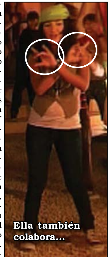
Ella también colabora...

los dos grupos, sino que las dos primeras de las filas están prácticamente una contra otra, la foto corro-