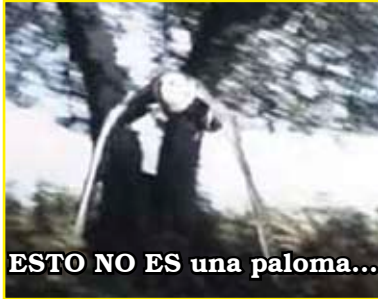
ESTO NO ES una paloma...

común de los Padres de la Iglesia que tenía contacto frecuente con los Ángeles de todos los coros.