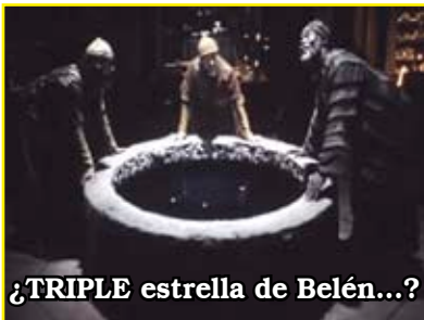
¿TRIPLE estrella de Belén...?

Continuamos entonces con el análisis de lo visto.