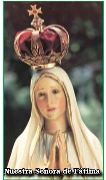
Nuestra Señora de Fátima

y con el pecado la muerte (Adán), por otro hombre ha venido la salvación y la Vida (Cristo)". El mismo San Pablo en la carta a los Gálatas dice algo fundamental cuando indica: "Al cumplirse la plenitud de los tiempos envió Dios a su hijo nacido de Mujer..." Y otro dato importante a tener en cuenta nos lo da el Apocalipsis cuando nos presenta a la Mujer coronada de estrellas que vence al Diablo (representación de la Virgen). No es casualidad que el primer