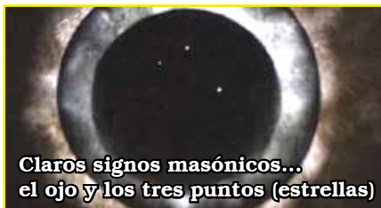
Claros signos masónicos... el ojo y los tres puntos (estrellas)

En uno de los pósters oficiales de la película (foto) podemos observar a los tres personajes: Melchor,