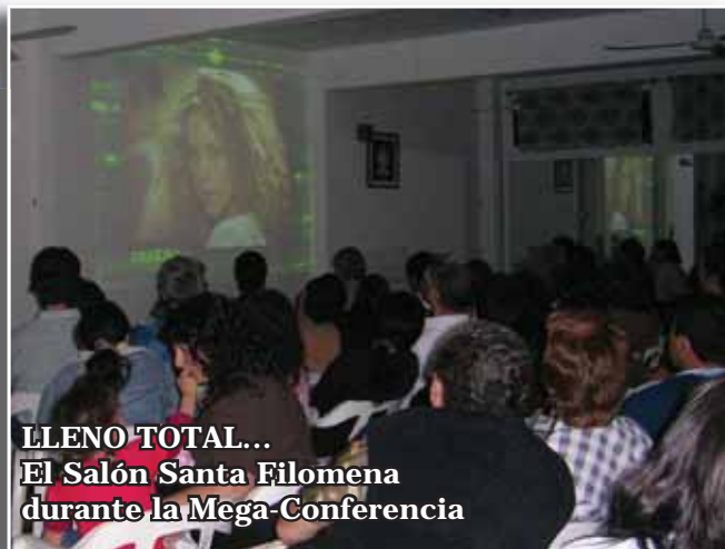
LLENO TOTAL... El Salón Santa Filomena durante la Mega-Conferencia

Finalizado el encuentro, que se extendió por casi 5 horas, surgió en los presentes el deseo de hacer al-