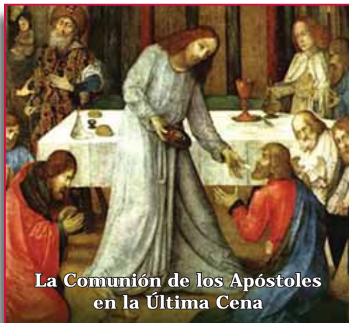
La Comunion de los Apóstoles en la Última Cena

Entregado en mano - No arrojar en la vía pública