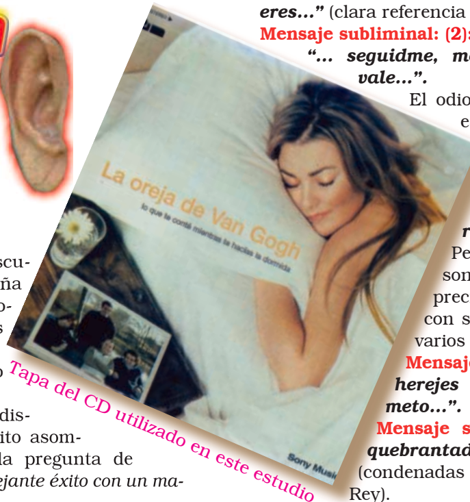
Tapa del CD utilizado en este estudio

Hasta aquí la muestra de esta impresionante colección de mensajes en un solo tema. Si Usted quiere, encuentre cómo se engarzan unos con otros. Hasta la letra normal con el mensaje oculto en muchas partes