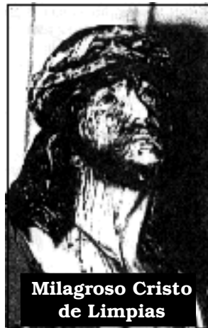
Milagroso Cristo de Limpias

... "Sentí la necesidad de tener un Oratorio y comprar una imagen grande: la Virgen de Lourdes o de Fátima. Fui a diferentes lugares y no encontré; hacer construir una me tomaría mucho tiempo. Yo tenía como una prisa interior por tener un Oratorio; yo no me explico por qué, nunca tuve uno: ahora lo quería. Buscando la imagen llegué a un negocio que no me gustó porque no tenían lo que yo buscaba. Entonces pregunté si no tendrían algo más aparte de lo exhibido en la vitrina. Después de ver las estatuas de la Virgen, que no me gustaron, me mostraron una del «Cristo de Limpias». Vi dos o tres, pero la que compré me llamó mucho la atención desde el primer momento. Algo también que debo decir es que yo estaba muy enferma: tenía una afección al sistema nervioso que me impedía caminar y realizar movimientos y me causaba mucho dolor. Los doctores me dijeron que no había mucho por hacer. Hubo momentos en los cuales no podía ni caminar ni recostarme por el dolor. Ahora estoy completamente sana. Volviendo a la tienda... decidí comprar la imagen porque me llamó mucho la atención y me pareció muy bonita, al mismo tiempo me llamó la atención un crucifijo grande. Entonces la traje y saqué todo lo que tenía en una habitación donde era mi gimnasio