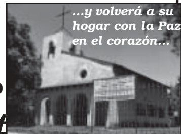
...y volverá a su hogar con la Paz en el corazón...

Calle 153 e/27 y 28 Berazategui Pcia. de Bs. As. Horario de visitas y atención: TODOS LOS DÍAS DE 15:00 A 16:00 HORAS.