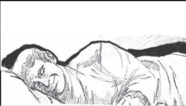
En las manos de la Divina Providencia