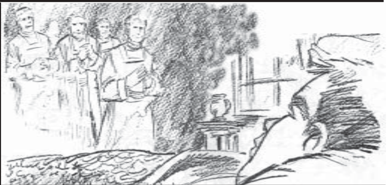
En las manos de la Divina Providencia