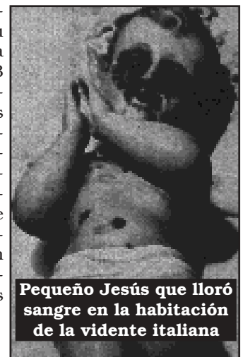
Pequeño Jesús que lloró sangre en la habitación de la vidente italiana

Mientras los mensajes y lacrیمaciones se repiten, su cuerpo se extenua y le llega la muerte en 1976, a los 33 años de edad. Nos han quedado las declaraciones de los numerosos testigos presentes y especialmente las fotos que nos recuerdan la preocupación de Dios si no cambiamos de vida y dejamos de ofenderlo. Ojalá, ante su vista, tomemos la seria decisión de convertirnos y ser la sonrisa del Niño Jesús y no sus lágrimas de sangre.