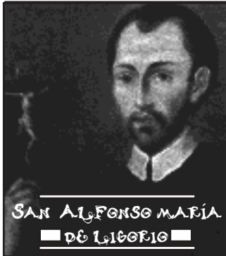
SAN ALFONSO MARÍA DE LIGORIO